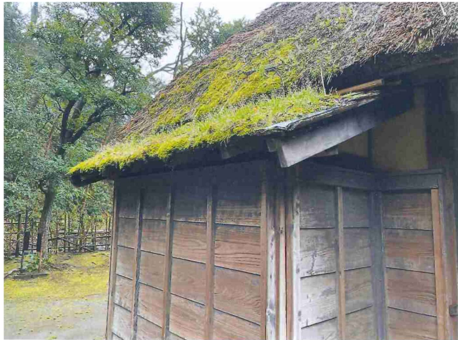
旧小池邸 正面 外観 茅葺屋根 屋根替えが必要 昨年より傷みが進んでいます