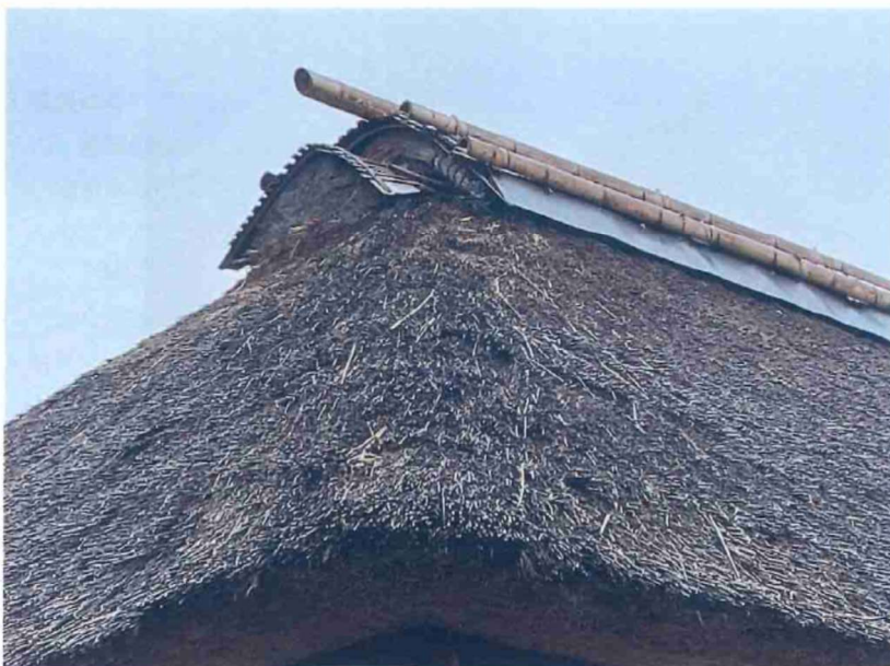
長屋門 北東 外観 茅葺屋根 差茅が必要 グンは令和4年度に応急補修済