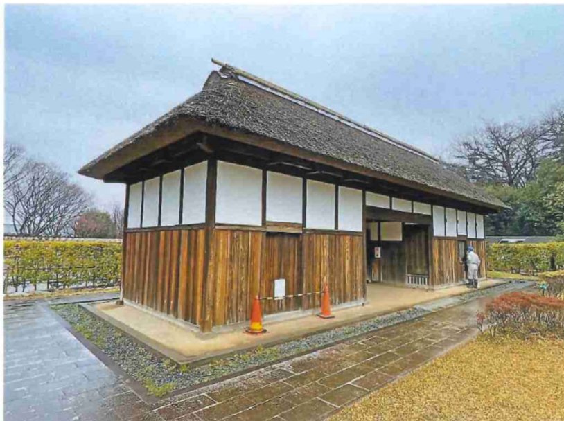
長屋門 北東 外観 茅葺屋根 差茅が必要