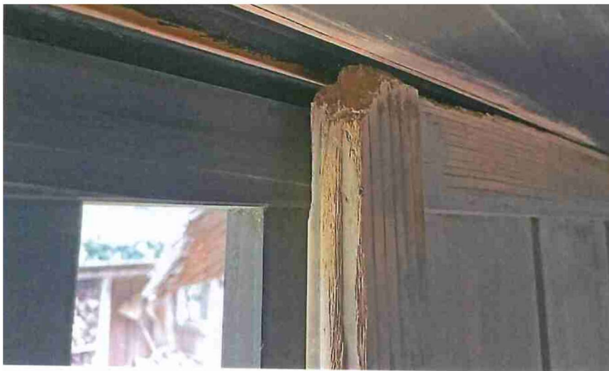
旧小池邸 北面 えん 雨戸 リスがかじったことによる建具の破損