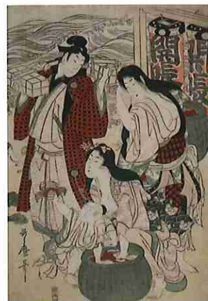
二代喜多川歌麿 「題名不詳 (江の島弁財天開帳)」