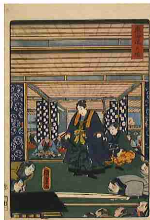
二代歌川国貞 「東海道 戸塚」

本展では、二代目浮世絵師たちが描いた藤沢ゆかりの作品を展示します。師匠の絵と比較しながら、襲名絵師たちの個性や奮闘ぶりを存分にお楽しみください。