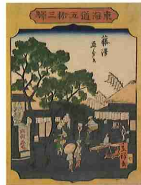
二代歌川広重 「東海道五拾三駅 藤沢 追分道」

浮世絵師の中には、著名な師匠の名を受け継ぎ、二代目、三代目を名乗って活躍した者が多くいました。二代目を襲名するという事は、歌舞伎役者と同様に、師匠の名声や技術を受け継ぐばかりでなく、さらなる飛躍が期待されることでもあります。