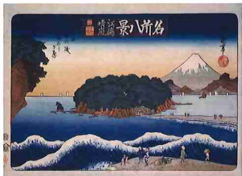
二代歌川豊国「名所八景 江ノ嶋晴嵐」