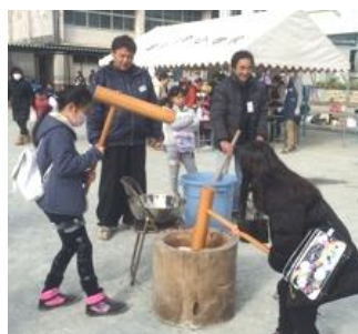
息を合わせて「よいしょ！」

1月17日(日)富士見台小学校でPTA主催のおやじの会が毎年恒例のもちつき大会を開催した。15年以上も続いている大好評な行事は、もちつきの他にも豚汁、ポップコーン、肉まん、当てくじ、ゲーム、アトラクションなど盛り沢山で賑わっていた。