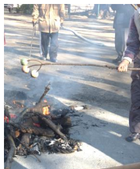
3色(白、赤、緑)のお団子を焼く

「市民センター、北消防署長後出張所などの協力により、やつと実施することが出来たのでこれからも継続できるように努力したい」と関係者は話す。