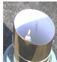
いく中、地域の親睦と子ども