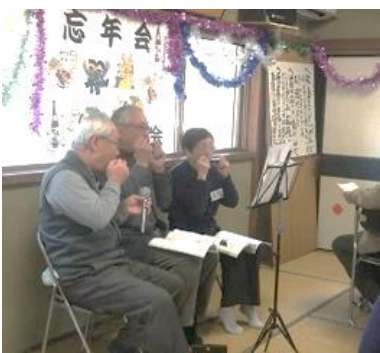
息の合ったハーモニカ演奏

いる。昨年末には第7号となった。記事の内容は役員紹介や行事報告、今後の予定があり、編集後記など意欲的な活動に脱帽だ。