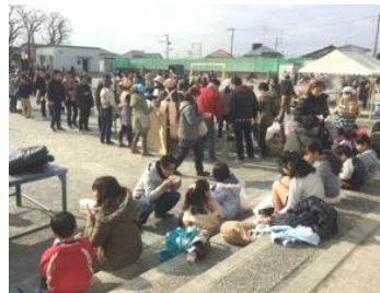
「おいしいね！」 沢山の行列が続く

「楽しいもちつき大会がはじまります！」校長先生のかげ声に参加者の笑顔がこぼれる。もちつきは、一晩水に浸したもち米をせいろで