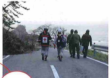
▲寸断された道路を自衛隊員と進む同救護班(石川県珠洲市)