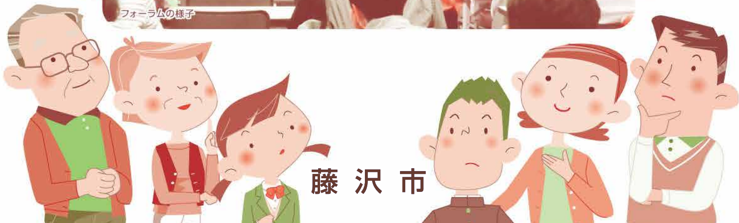
フォーラムの様子