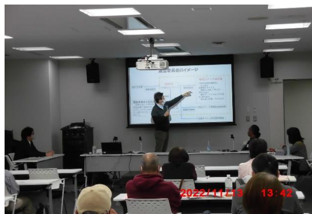
セミナーで空家の利活用の事例を紹介する「まちづくりハウスみろくじ」の代表