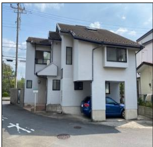
空家を利活用した「まちづくりハウスみるくじ」