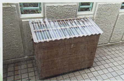
ベランダ等でも使用できるタイプ