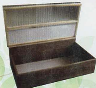
土の上に直接設置するタイプ