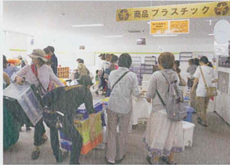
リユースイベント