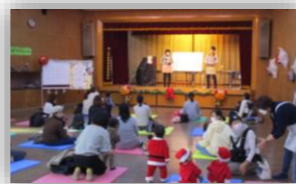
ここにクリスマスコンサート