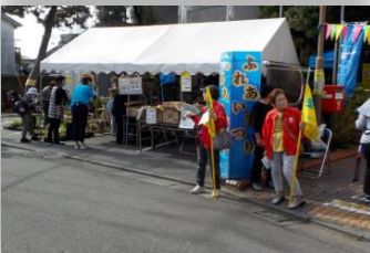
片瀬地区ふれあいまつり