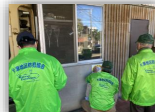
子ども110番看板の貼替え