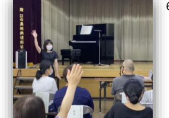
潮の子フォーラム