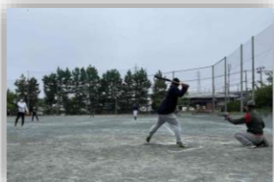
ソフトボール大会