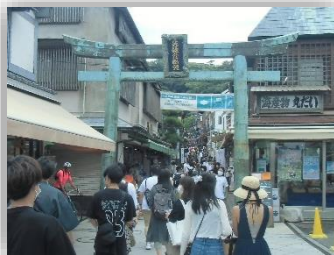
観光客で賑わう江の島の参道