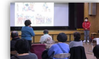
啓発イベント（映画上映会・講演会）