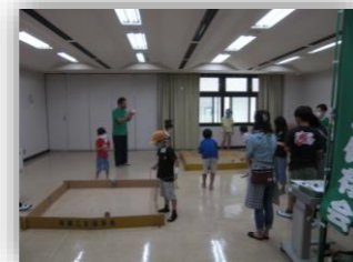
わくわく教室 (子ども会連絡会・青少年指導員・片瀬公民館主催)