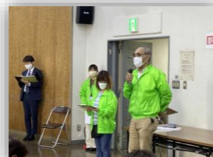
啓発活動（福寿学校）