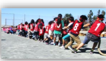
地区レクリエーション大会