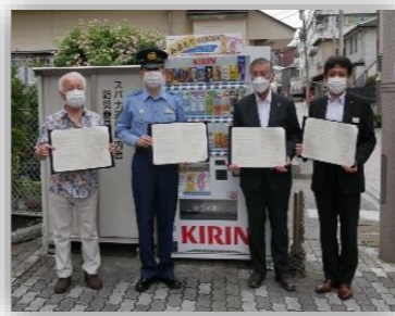
防犯カメラ機能付き自動販売機除幕式の様子

片瀬すばな通り商店会の、スパナ会館前に今年8月5日、防犯カメラ付き自動販売機が設置され、スパナ通りの安全を見守りしています。