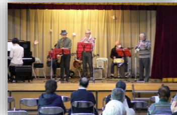
春うららコンサート

子どもの健全な育成発達に取り組んでいます。今年度は、弁天橋花いっぱい愛好会の花植えの参加、片瀬公民館・片瀬地区青少年指導員と共催で行う「わくわく教室」の実施、各子ども会による夏の朝のラジオ体操の実施等を行っております。子どもたちの健やかな成長を片瀬地区の子ども会が一丸となって見守っています。