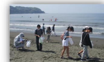
クリーン活動（片瀬海岸清掃）

落書き消しやゴミ拾い、環境問題に関する講演会等、環境美化運動の推進に取り組んでいます。