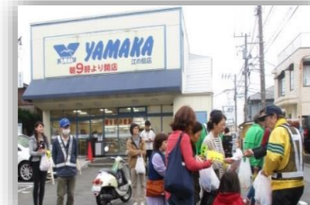
啓発活動（やまか江の島店）

日頃、交通事故防止運動に取り組んでいます。交通に関する街頭キャンペーン、イベント時の交通整理、通園・通学児の安全を確保するために、原則毎月1日と15日に登園・登校時間帯に合わせて通学路での街頭指導を実施し、交通事故防止を図っています。