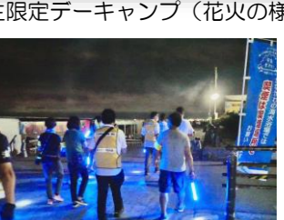
夏期江の島周辺夜間パトロール