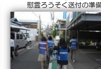
見守りパトロール