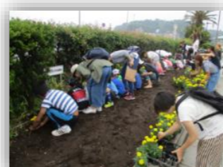
弁天橋花植え参加