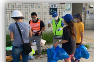
夏期片瀬海岸周辺ごみ拾いキャンペーン