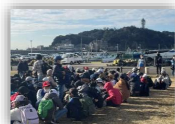
片瀬漁港見学（片瀬小学校社会科見学）