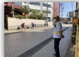
安全・安心ステーション見守り活動