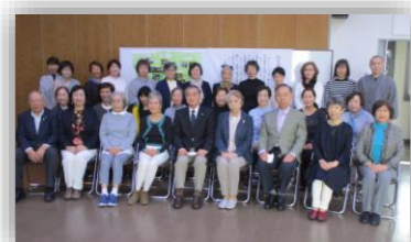
民生委員・児童委員の方々