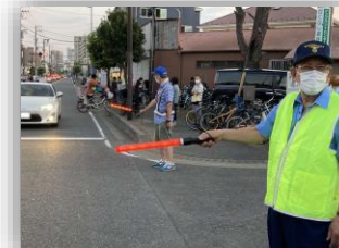
交通整理（諏訪神社例大祭）