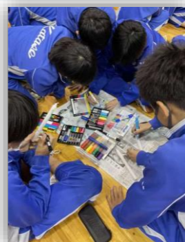
阪神淡路大震災 慰霊ろうそく送付の準備

小学生の遊び帰り、中学生の部活帰りの時間帯のパトロール、小学生の家庭科ミシン授業の補助など、地域の特色を生かし、ボランティアの方々のご協力のもと、活動しております。