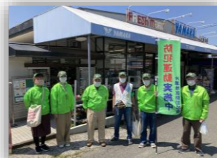
啓発活動（やまか片瀬山店）

犯罪のないまちづくりに取り組んでいます。防犯の啓発活動や子ども110番看板の貼替え活動、子どもの登下校時の見守りを行っております。