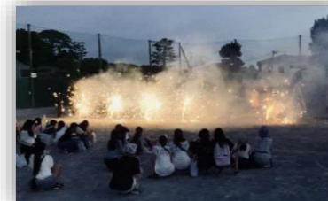
6年生限定デーキャンプ（花火の様子）

青少年の健全育成や非行防止に取り組んでいます。令和3年度には参加する児童を小学6年生に限定し、デーキャンプを開催しました。また、小中学校の先生を講師として子どもに関する情報を交換する「潮の子フォーラム」、様々な関係機関が集まって行われる「夏期江の島周辺夜間パトロール」など規模や内容を変更しながらも活動を行っています。