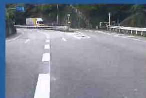
白線を引き直し、視認性を改善！

このほか「柵が壊れている」、「照明灯が点灯していない」などの情報もお寄せください。