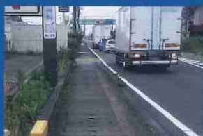
側溝の蓋がガタついて、つまずきやすい