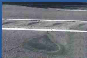
穴ぼこを補修し、安全を確保！