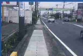
蓋を交換して、歩きやすく改善！