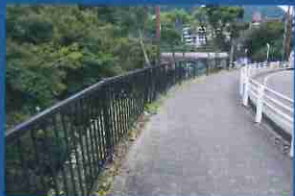
雑草を取り除き、歩行空間を確保！