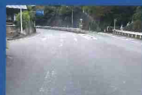
白線が薄くなっている