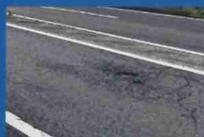
道路に穴ぼこがあり危険