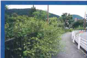
雑草が生い茂って歩きにくい