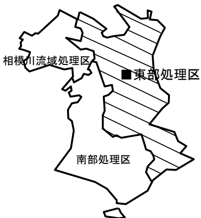
藤沢市処理区分図