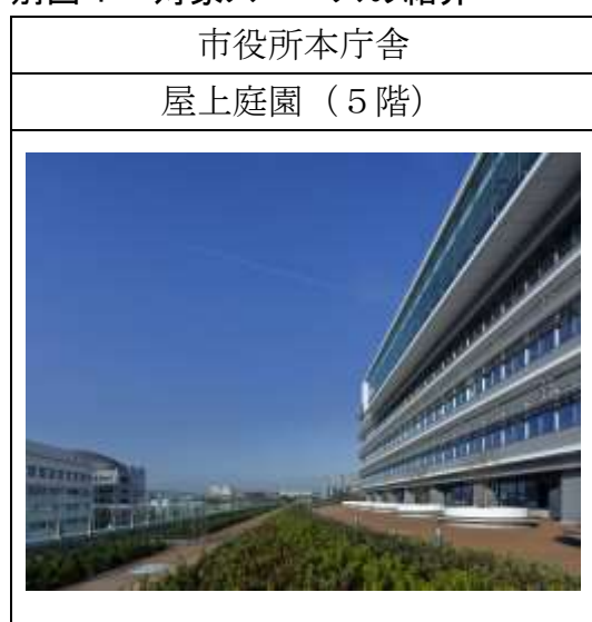
別図 1 対象スペースの紹介