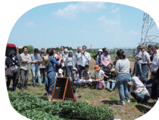
毎週開催 日曜講習