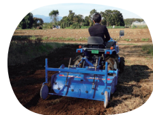
上級者コースでは トラクターに乗ったりも！