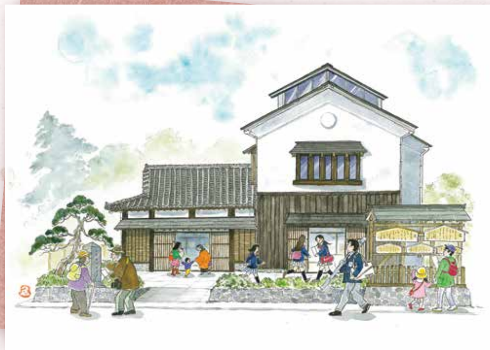
挿絵 佐野 絵里子