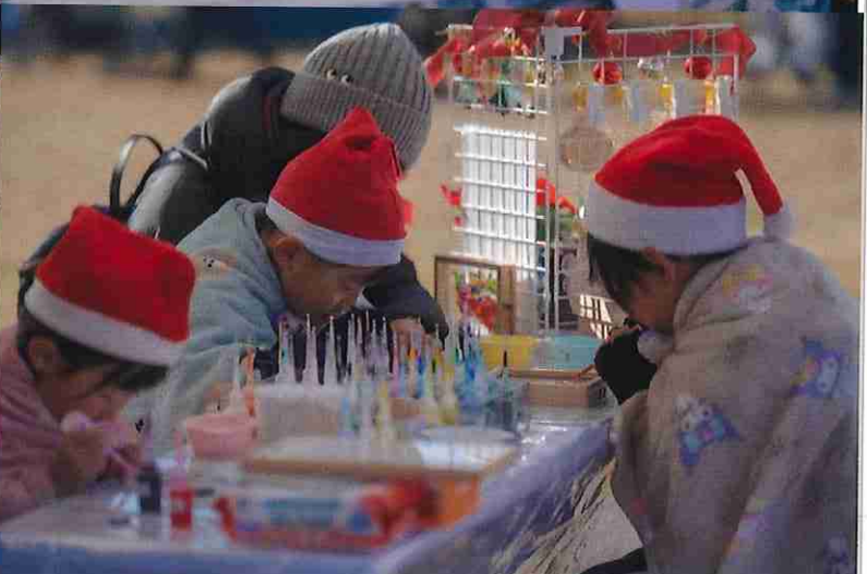
※12月クリスマスマーケット時の写真となります