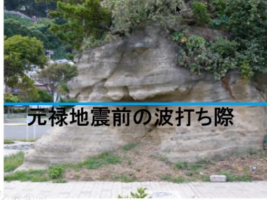
聖天島に残る波打ち際跡 ノッチ