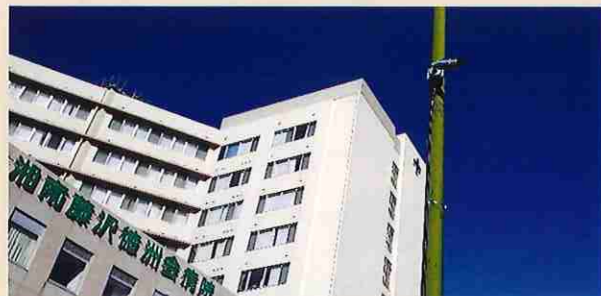
徳洲会病院付近から車両(交差点)を監視

令和2年、明治市民センターから地区商店会として明治地区郷土づくり推進会議に参加してほしいとの相談があり、安全安心部会の委員に所属し2年間、活動を行っています。また、定例会において商店会の活動報告及びこれまでの経緯とともに防犯カメラ設置の報告を行い、明治地区の犯罪の抑止力の一旦を担っています。