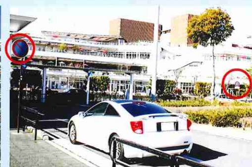
皆様のご意見から 駐車禁止へ