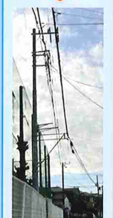
明治中学校 新たな電柱設置