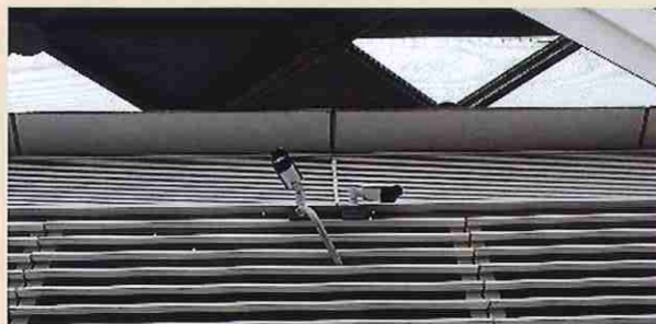
ロータリー中央やトイレ付近を監視