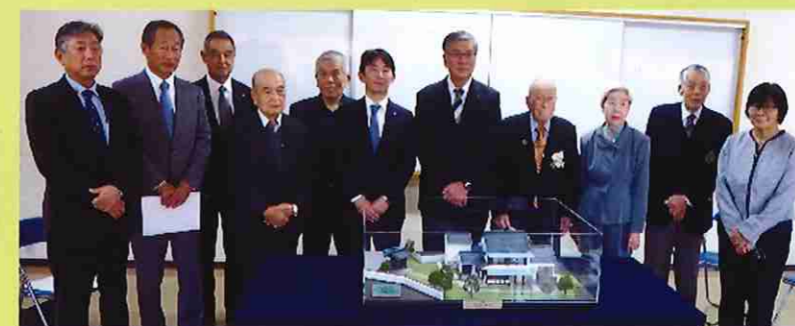
旧三鶯八郎右衛門家住宅 模型寄贈式 2021/11/17

VR機器の設置を市が明治郷土史料室に常設してくださることで、明治地区の歴史文化の醸成に繋がるとともに郷土史料室を訪れるお一人おひとりに藤沢の郷土愛が深まり、地域が一層発展することを期待しています。