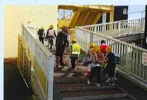
辻堂新町に住む小学生、 八松小への通学跨線橋