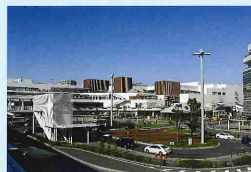
通勤・通学送迎用 長時間駐車有