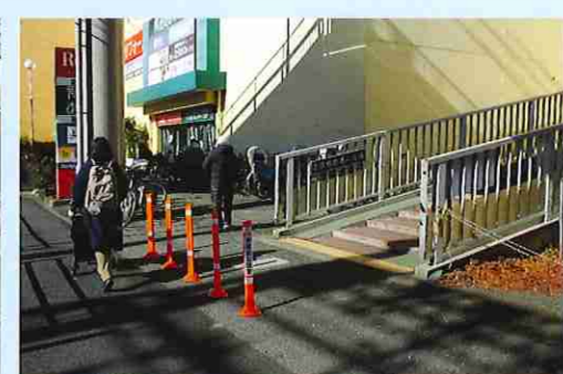
とびだし注意 5本のポール設置