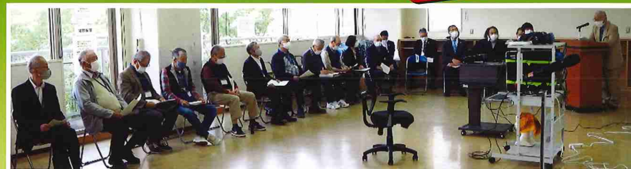
旧三鶯八郎右衛門家住宅 VRオープニング式 2021/4/27