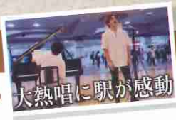
大熱唱に観客が感動