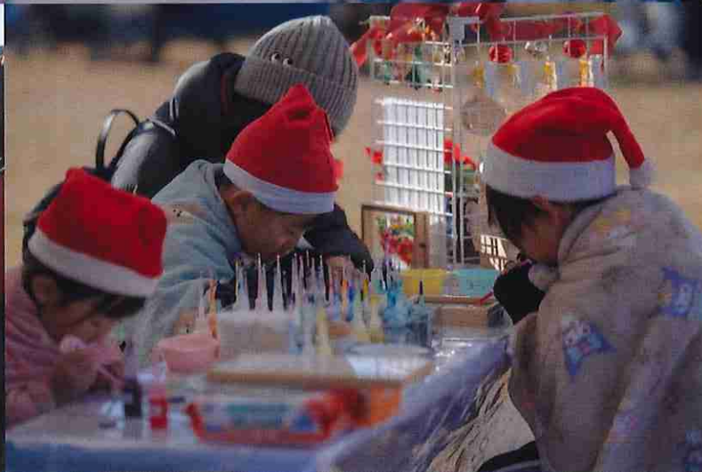
※12月クリスマスマーケット時の写真となります