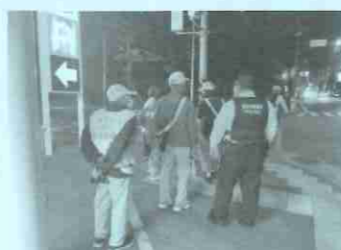
防犯夜間パトロールの様子