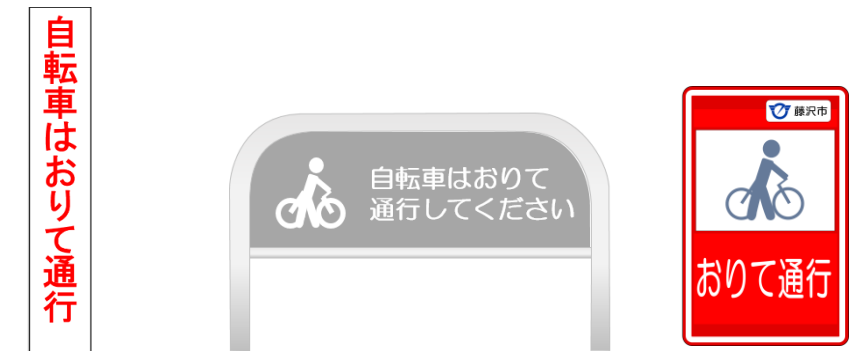
図1 「自転車押し歩き」を促す案内の例

駅中心部の外周道路と駅前交通広場のそれぞれの歩道において、歩行者の通行に支障にならない範囲で「自転車押し歩き」を促す案内を設置します（図1）。