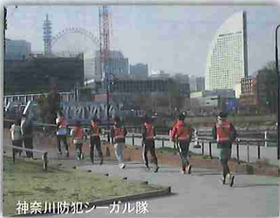
神奈川防犯シーガル隊