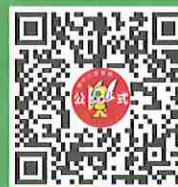
神奈川県警察防犯大使 藤田愛理さんと学ぶ 子供安全対策「おおだこポリス4つのおやくそく」