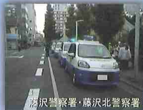
藤沢警察署・藤沢北警察署