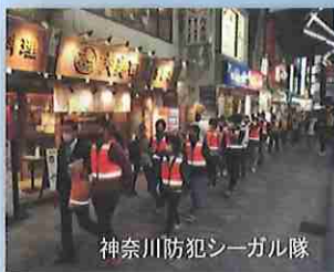
神奈川県防犯シーガール隊

問合せ先 神奈川県自転車商協同組合 TEL045-311-6168 http://www.kanasho.jp