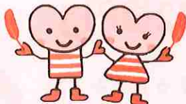
藤沢市社協キャラクター たーすけくん&あいちゃん